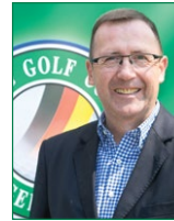
Karl-Friedrich Löschhorn Golf Club München Eichenried